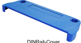
DINRail-Cover Bestellnummer / Order number: 400.13542