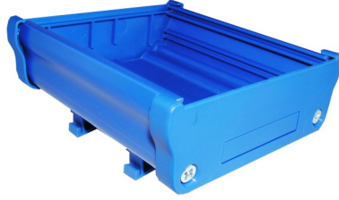
DINRail-Schiene für REPEATER Bestellnummer / Order number: 400.14551