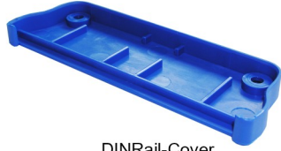
DINRail-Cover Bestellnummer / Order number: 400.13542